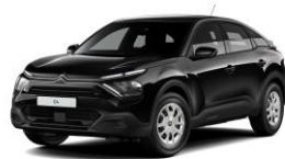
PERLA NERA SCHWARZ