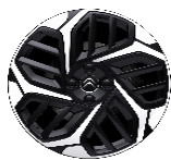
18 Zoll Leichtmetallfelgen CAMELIA 2-farbig