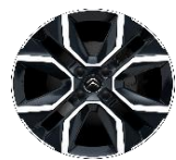
18 Zoll Leichtmetallfelgen HANOI