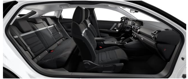
INNENRAUM URBAN GREY